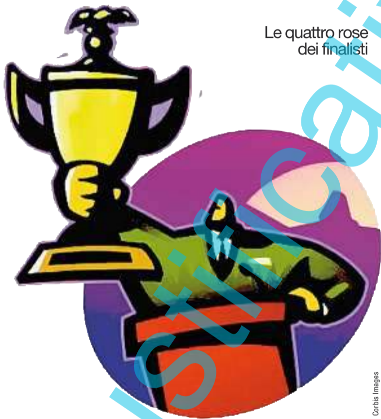
Le quattro rose dei finalisti

Nessuno ha la sfera di cristallo, ma solo idee e strategie personali per navigare sui mercati. Ancora in burrasca.